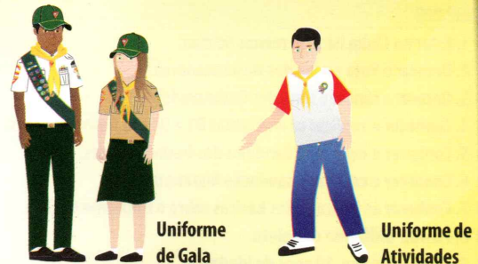
Uniforme de Gala

Foi projetada em 1948 por Henry Berg e mantém até hoje as mesmas características. Divide-se em quatro partes com duas cores predominantes e o triângulo ao centro.